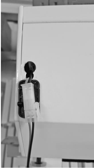
1. Connecter les fiches