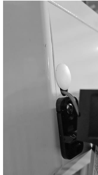
4. cliquer le panneau et mettre le bouchon