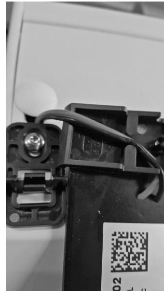
2. Kabel durch Support-Nut führen