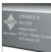
Jeder Rollladen ist ein Unikat und ist auf der Endschiene mit einer ID-Nummer versehen. Alle verbauten Teile können unter www.rufalex.ch/idsuche aufgerufen werden