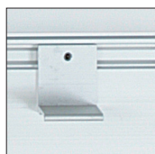
Anschlagwinkel 40 x 35 mm mit Schraube