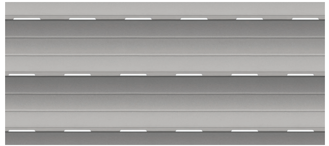
Ajours 20 x 2 mm