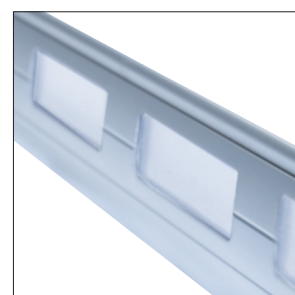
Profil translucide RUFALUX