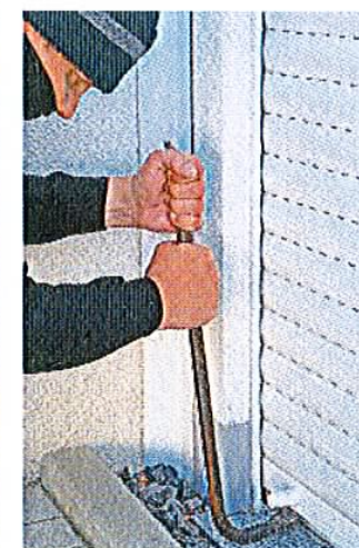
Da macht das Brecheisen zweiter.

Das Aluminium, das für die Profile bearbeitet wird, ist Recyclingmaterial und verbraucht im Gegensatz zum herkömmlichen Bauxit, das für