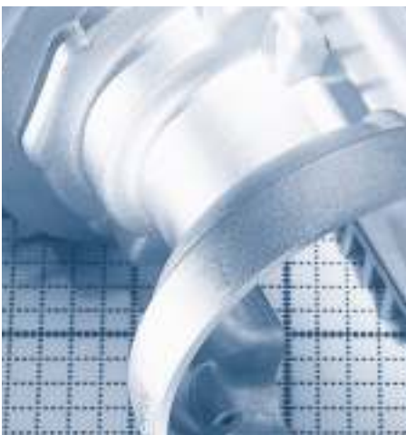
Aluminium ermöglicht eine Kreislaufwirtschaft ohne Qualitätsverluste.

Mit der Einführung des Dualen Systems Deutschland wurde im Verpackungssektor ein flächendeckendes System der Erfassung, Sortierung und Verwertung auch von Aluminiumverpackungen auf-