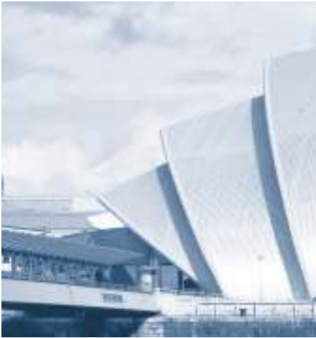
Aluminiumprodukte im Bausektor schaffen eine Synthese aus hoher Funktionalität, Ästhetik und Design.